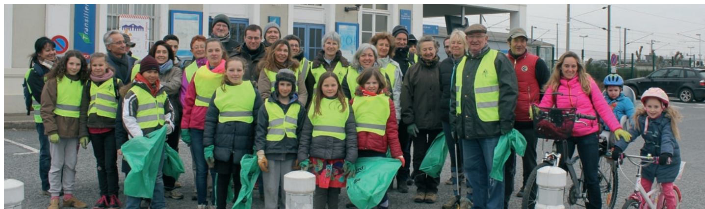
Les bénévoles en 2016

Nous vous attendons donc nombreux pour cette opération le samedi 19 mars 2017 à 14h30 au départ du parking de la gare de Méré.