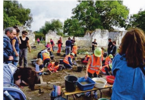
Le nouveau conservateur a loué les associations en charge du site pour les efforts pour l'implication des scolaires et des étudiants sur les chantiers.

claré avoir été fort impressionné par la qualité du site qu'il a visité cet été. Puis il a détaillé ses propositions de soutien avec trois axes majeurs.